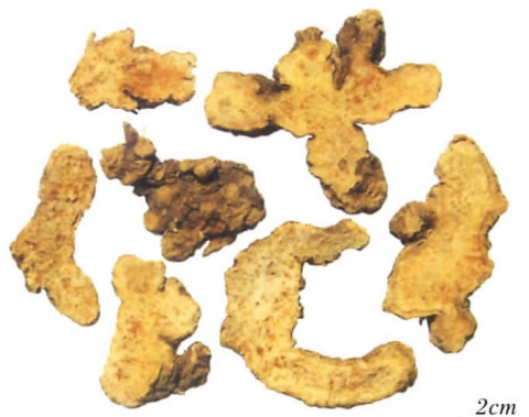
ภาพที่ 4 ซังจู้เพียน 3

การเก็บรักษา เก็บในภาชนะแห้งปิดสนิท แล้วนำไปวางไว้ในที่แห้ง มีอากาศถ่ายเท ป้องกันเชื้อราและแมลง 7