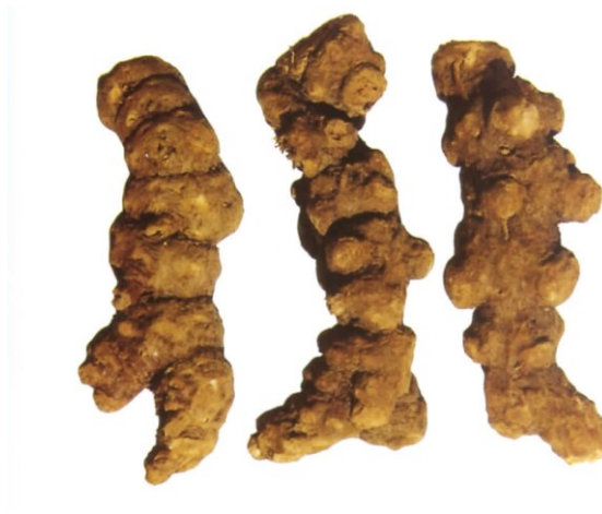
ภาพที่ 1 วัตถุดิบสมุนไพรเหมาขิงจู้ Atractylodes lancea (Thunb.) DC. 5

วัตถุดิบสมุนไพรเหมาขิงจู้มีลักษณะเด่น คือ ลักษณะเป็นก้อนคล้ายไข่มุกเรียงกันเป็นรูปทรงกระบอก ไม่เป็นระเบียบ ผิวนอกมีสีน้ำตาลอมเทา เนื้อแน่นแข็ง แตกหักง่าย ภาคตัดขวางเรียบ มีกลิ่นหอมเฉพาะตัว รสหวาน ขม เผ็ด โดยจากประสบการณ์ดั้งเดิม วัตถุดิบสมุนไพรที่ดี ต้องใหญ่ เนื้อแน่นแข็ง ภาคตัดขวางต้องมีจุดน้ำมันสีแดงชาดมาก กลิ่นหอมฉุน 5